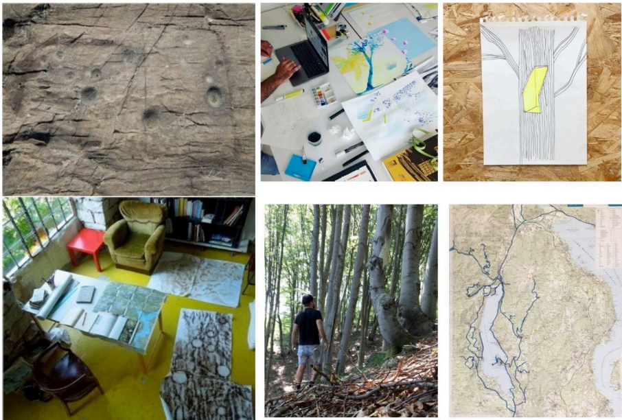
Fig. 2 – Massi coppellati, carte porose e Woodsplace .

rati attraverso il tempo e fortemente legati a uno spazio tangibile (figura 2). Nelle aree pedemontane si è sviluppato un altro progetto inedito, finalizzato a portare forme pittoriche nei boschi ( Woodsplace ) creando un parallelo naturale a quella che in città viene definita come street art : si tratta di opere esposte che subiscono mutamenti seguendo lo sviluppo biologico delle piante (figura 2). L'unico modo per trovare e mappare queste opere è l'uso di coordinate GPS. Le opere sono accompagnate da un testo come questo: «Quest'opera non dà diritto ad una proprietà: nessuna pianta nessun terreno, nessun sasso e nessun animale sarà vostro. Chi guarda quest'immagine non è tenuto ad andare a rintracciare il suddetto luogo, può accontentarsi di sapere che esso esiste. Gli interventi pittorici sono stati eseguiti con vernici naturali per non rovinare, danneggiare, disturbare la normale attività biologica dell'albero o degli alberi in caso di interventi su più tronchi. L'artista non sarà responsabile di eventuali danni a cose o persone nel bosco durante la ricerca del suddetto luogo, né di eventuali morsi di animali selvatici o domestici liberi nel bosco. Per evitare delusioni consigliamo di non cercare il suddetto posto, o almeno di farlo in periodi favorevoli, in giornate soleggiate e con temperature miti. Quest'opera vale come autentica di sé stessa ed è riprodotta in tiratura 1/1».