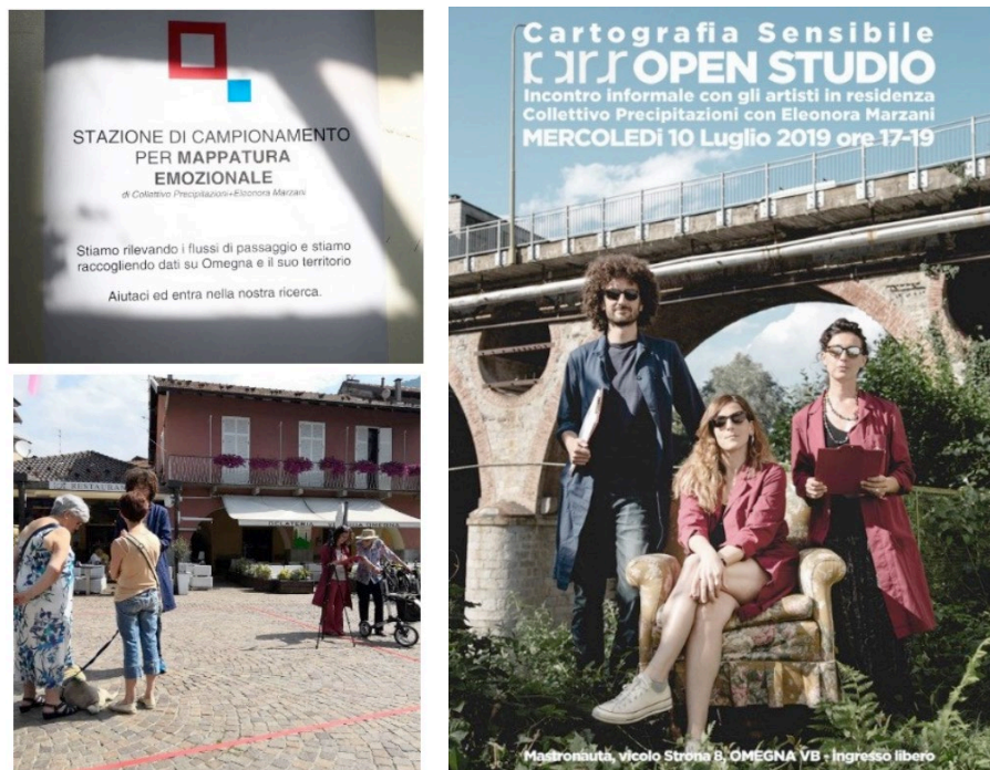
Fig. 4 – La rilevazione partecipata del Collettivo Precipitazioni.