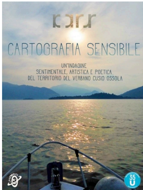
Fig. 1 – Locandina del progetto «Cartografia Sensibile».

A partire dal 2017 CARS ha avviato il progetto «Cartografia Sensibile. Un'indagine sentimentale, artistica e poetica del territorio del Verbano Cusio Ossola». Si tratta di un progetto fluido che si è proposto di raccogliere, nel corso del triennio 2017-2019, un rilievo sentimentale dell'area del territorio esteso del Verbano Cusio Ossola, sotto il profilo geografico, naturalistico, antropologico e culturale, attraverso la definizione di una cartografia sensibile redatta liberamente da artisti contemporanei italiani (figura 1). Il progetto si propone di generare una «lettura sensibile», una descrizione «quasi-atlante» del territorio e una sua narrazione. Come precisato dalla direzione artistica e organizzativa 3 , l'aggettivo sensibile è stato ritenuto il più pertinente e adatto, in quanto è il rilievo stesso a potersi qualificare e declinare in tal modo (reale, materiale, fisico, concreto, visibile, tangibile, percepibile, percettibile, rilevabile, fenomenico; chiaro, evidente, grande, forte, intenso, notevole, rilevante, apprezzabile, significativo, sostanzioso, considerevole, congruo; emotivo, impressionabile, delicato, nervoso; aperto, disponibile, attento, cosciente, reattivo, ricettivo).