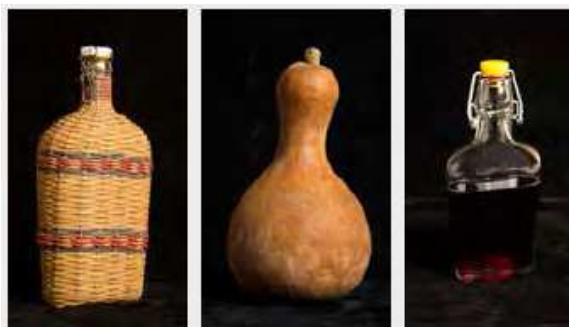
Figura 3. Bottiglie in vetro per il vino. La cussa , zucca in piemontese, era uno dei contenitori più arcaici e tradizionali per trasportare e custodire al fresco, sino all'ora del pasto, il vino.