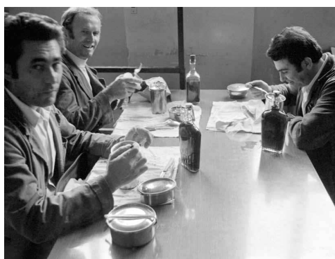
Figura 4. Barachin e vino sul tavolo operaio, 1973, foto Mauro Raffini.