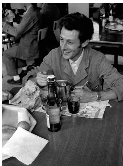
Figura 5. Operaio della Emanuel in mensa, 1973, foto Mauro Raffini.