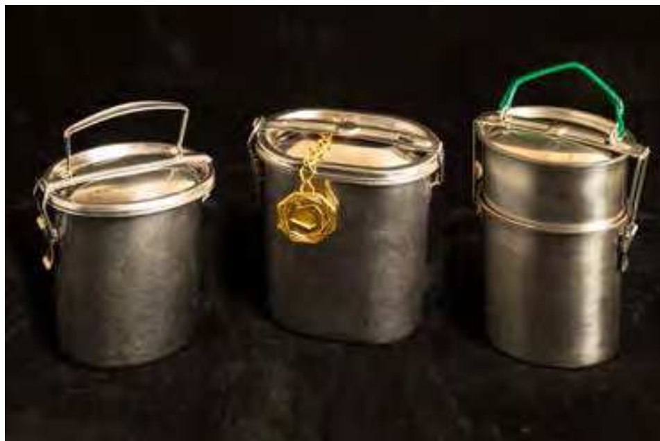
Figura 1. Barachin a due scomparti in acciaio. Il recipiente più piccolo, posto nella parte superiore del barachin, di solito conteneva la seconda portata. La parte più capiente del barachin, di norma immersa nell'acqua degli scaldavivande, era destinata a custodire il primo piatto: la minestra o la pastasciutta.