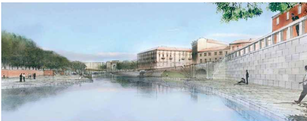
Fig. 5. La Darsena, porto storico di Milano, verrà riqualificata in occasione dell'Expo, grazie alla costruzione di itinerari di mobilità dolce collegati al progetto "Via d'Acqua".

Fig. 4. Il progetto Via d'Acqua-Parco Expo, parte integrante del "Dossier di candidatura Expo 2015", ha i seguenti obiettivi: ricucire il legame storico di Milano con l'acqua; potenziare e valorizzare il sistema dei parchi della cintura ovest di Milano; rilanciare il ruolo strategico delle cascine e delle aree agricole, coerentemente con il tema di Expo "Nutrire il Pianeta, Energia per la Vita; favorire la mobilità dolce.