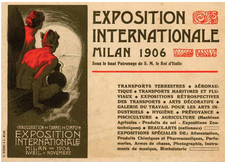
Fig. 1. Locandina dell'Esposizione Universale del 1906. I promotori della manifestazione furono la Lega Navale e l'Associazione Lombarda dei Trasporti. Le due sedi (il parco Sempione e l'area della ex Piazza d'Armi) su cui sorsero gli edifici dell'Expo, furono collegate da un'avveneristica ferrovia sospesa.

ste manifestazioni hanno rappresentato il loro tempo, spesso anticipando i cambiamenti e dando rilievo alle innovazioni produttive, tecnologiche, industriali e culturali in atto nei diversi paesi del mondo.