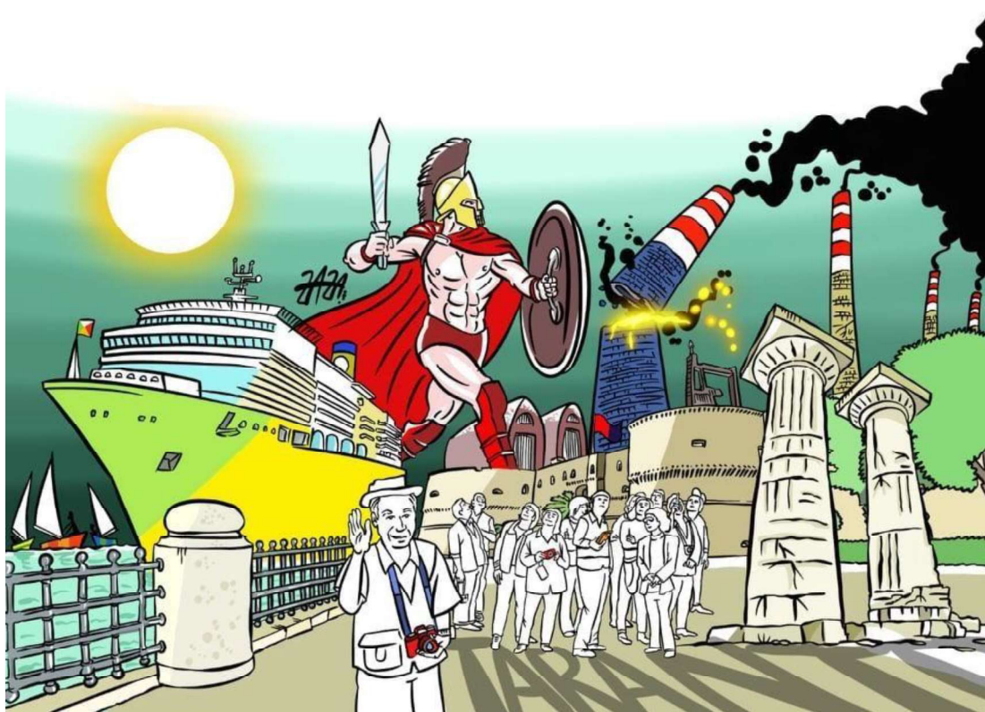
Figura 1: “Tra storia e turismo, il futuro dei nostri figli” , illustrazione di Zaza Leonardo in occasione della manifestazione “La domenica dei tarantini” organizzata da Ass. Genitori tarantini, Ass. PeaceLink, Comitato Donne e Futuro per Taranto libera, Comitato Quartiere Tamburi, LiberiAmo Taranto, Lovely Taranto, Taranto Lider Cittadine e cittadini..

Tuttavia, il recente delinearsi di un paesaggio dell’energia (Ghosn, 2009, Nadaï e Van Der Horst, 2010; Castiglioni e Ferrario, 2015), unitamente a quello già presente dell’acciaieria induce a pensare che le politiche di sviluppo basate sul turismo non possano prescindere dalle relazioni con il contesto industriale del territorio tarantino. Del resto, alcuni importanti città italiane, note per il loro patrimonio culturale e l’indotto convivono da decenni con imponenti insediamenti industriali e si confrontano con tutte le problematiche che ne conseguono. Solo per fare alcuni esempi, citiamo qui Venezia e Porto Marghera, Mantova e le sue raffinerie, Siracusa e il vicino polo petrolchimico, oppure il bicarbonato e le spiagge bianche di Rosignano. Pertanto, è verosimile attendersi che il turismo a Taranto si configurerà come opportunità di integrazione e diversificazione del tessuto socioeconomico locale, piuttosto che come un’alternativa alle attività industriali, ovvero capace di ridimensionare il peso esercitato dal complesso acciaieristico sulla città.