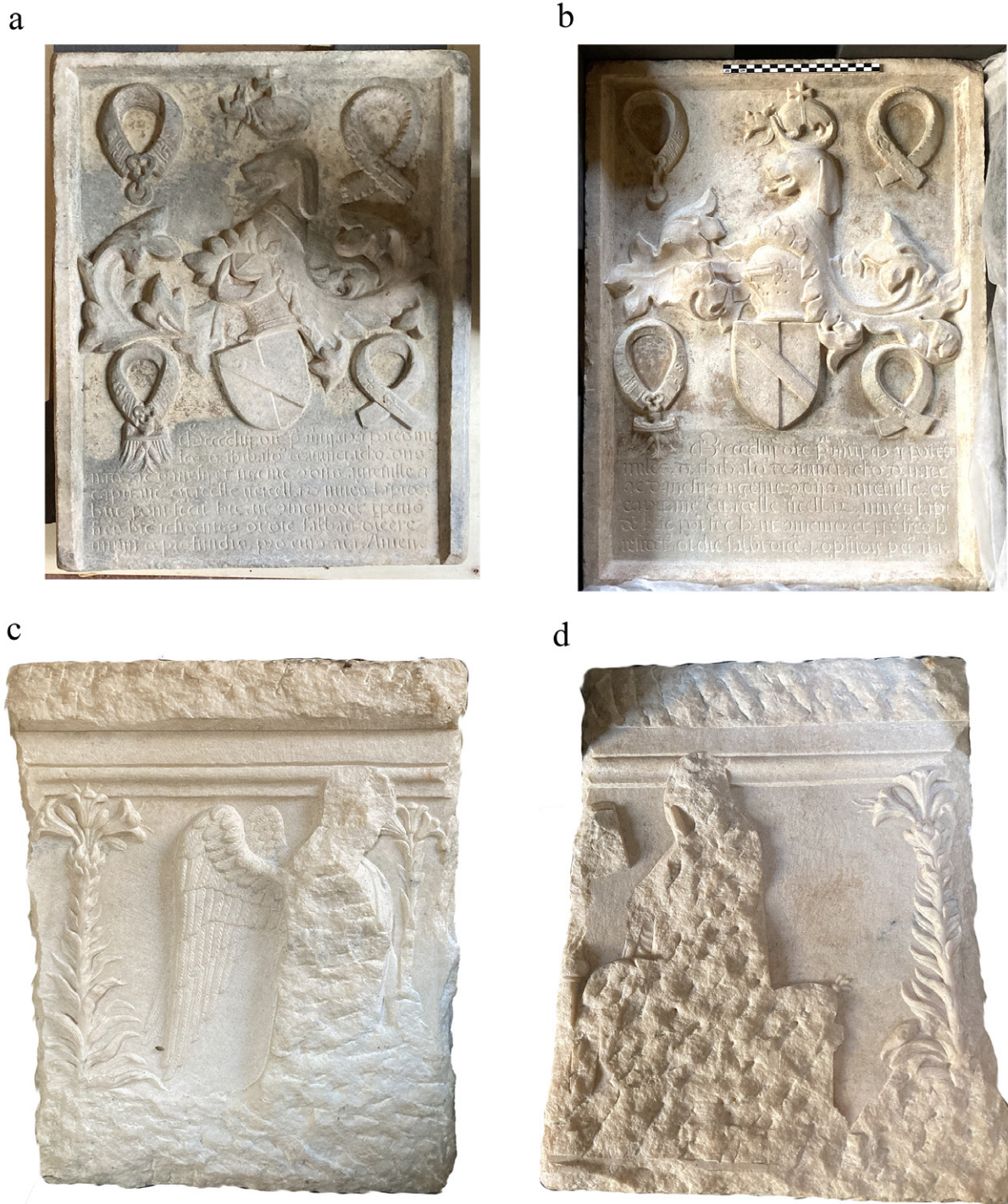
FIGURA 10. Vercelli, Museo Leone. Lastre in marmo di Candoglia con: a) e b) stemmi di Thibaud d'Avanchy; c) e d) scena di Annunciazione scalpellata: c) Arcangelo d) Vergine. Retro delle lastre.

nella chiesa di San Francesco, recano iscrizioni commemorative del personaggio che si concludono con la data del 1453. Essi risultano dalla rilavorazione, al rovescio e probabilmente con un ritaglio in due parti, di una lastra con Annunciazione forse già di primo Quattrocento (Fig. 10 c-d), opportunamente privata, con distacco a punta, di tutte le sporgenze che potevano ostacolare l'inserimento a muro dei due "nuovi" supporti epigrafici.