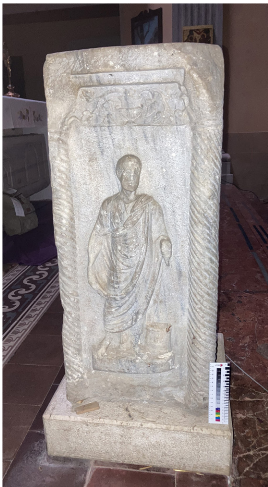
FIGURA 5. Romagnano Sesia, San Silano. Ara romana in marmo con togati attualmente in uso come leggio.

Il sarcofago appare per la prima volta nel 1771, in uno scritto di don Giovanni Velini, cancelliere del vescovo di Novara Bertone, presente al momento dell'intervento. Il De Paulis, parroco di Romagnano che riprende il testo del Velini a distanza di un secolo, riferisce che, in quell'occasione, «distrutta l'antica mensa» dell'altare maggiore, «si videro apparire i segni di un'urna ivi collocata», che, prosegue il testo, è detta «di marmo bianco, ermeticamente chiusa con tavola dello stesso marmo» 29 . Questa è identificabile con il sarcofago marmoreo, in apparenza a suo tempo inglobato nell'altare maggiore. Dopo varie vicissitudini, nel 1971, in seguito alle nuove disposizioni liturgiche che seguirono al Concilio Vaticano II, il manufatto venne riutilizzato come basamento per la nuova mensa eucaristica 30 , così come appare nella fotografia allegata alla scheda della Soprintendenza, datata 1974, e come si trova ancora oggi. Del coperchio del sarcofago non si ha però alcuna notizia.