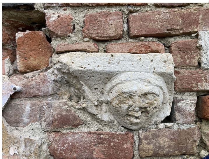
FIGURA 12. San Genuario (Crescentino, VC). Chiesa già abbaziale. Mensola con raffigurazione umana.

A questo riutilizzo di un pezzo antico, cui viene data grande visibilità, nel medesimo contesto abbaziale si accompagna la realizzazione ex novo in età medievale di tre pannelli integri con un falconiere, un agnus Dei e un blocco decorato su due facce, con uno stemma araldico e una sirena caudata 62 . Variamente datati alla prima metà del Quattrocento o alla metà del Duecento 63 , essi appartenevano a un monumento, forse