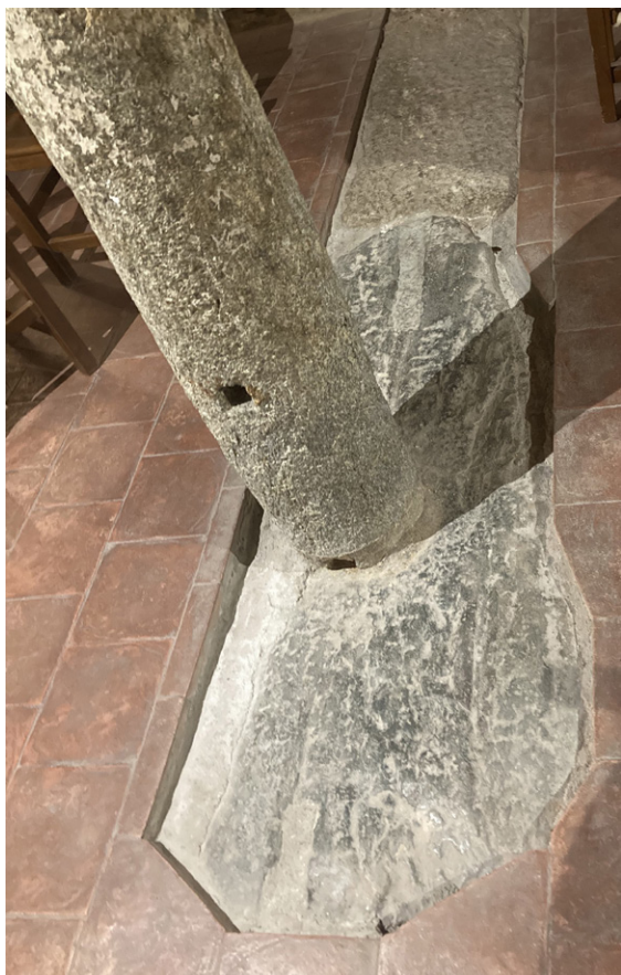
FIGURA 6. Santhià, Sant'Agata, cripta. Fusto di colonna e lastra pavimentale che recano traccia di incassi per l'arredo liturgico.