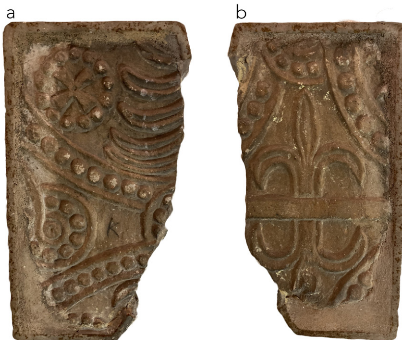
FIGURA 1. Vercelli, Museo Leone. Frammento di lastra (pluteo?) altomedievale (VIII-IX secolo) decorato su entrambi i lati.

due facce un decoro simile per scelta iconografica, ornamentale ed esecutiva, ma differente nell'impaginato e soprattutto nell'orientamento. Le comuni caratteristiche ne lascerebbero plausibilmente supporre una contemporaneità di realizzazione, che sembra però contraddetta dalla disposizione degli elementi decorativi, aspetto che in casi analoghi ha fatto supporre una rilavorazione in tempi ravvicinati 7 .