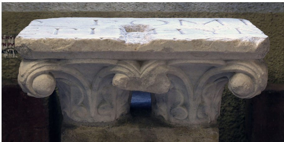
FIGURA 2. Vercelli, Museo Leone. Blocco marmoreo con iscrizione di Quintus Pompeius Epithymetus, rilavorato come capitello “a crochet” in età medievale.

intervallari, piccole croci a bracci patenti, scavati tuttavia all’interno, a differenza di quanto si osserva nel pezzo vercellese, che però non rinuncia al foro di trapano all’incrocio dei bracci stessi, a richiamare gli occhielli ben presenti in vari motivi cruciformi della bottega 12 . Particolare sembra invece il filo circolare di sole perline, che inquadrano la crocetta.