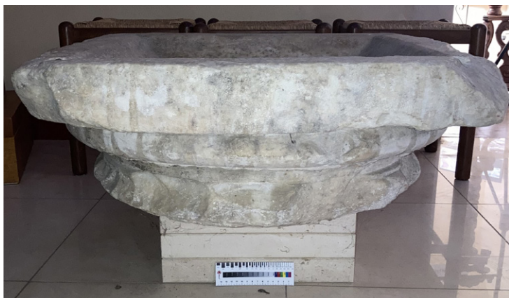
FIGURA 3. Romagnano Sesia, San Silano. Base di colonna riutilizzata come acquasantiera.

Per San Silano, si segnala con una base di colonna frammentaria (Fig. 3), rilavorata come acquasantiera e oggi conservata in una cappella laterale della chiesa, vicino all’accesso. Il pezzo potrebbe essere