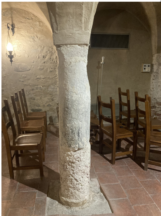
FIGURA 7. Santhià, Sant'Agata, cripta. Colonna della cripta formata dall'assemblaggio di blocchi di natura geologica differente (Foto V. Sala).

riportata dal Durandi nel XVIII secolo: due si conservavano nella cripta, uno dei quali con chrismon , e due si trovavano ai piedi del campanile. Durandi accenna anche al reimpiego di materiali nell'edificio di culto, quali «arche [...] tagliate, e ridotte, per formare la scalinata interna della chiesa collegiale» successivamente distrutta e rifatta 45 .