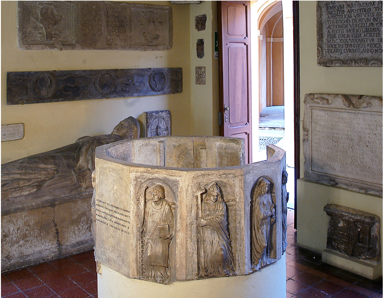
FIGURA 8. Vercelli, Museo Leone. Cosiddetto “ambone” da Santa Maria Maggiore.

Tra i pezzi forse più rappresentativi a questo proposito si annovera, alla fine del medioevo, il cosiddetto “ambone” di Santa Maria Maggiore (Fig. 8), un assemblaggio novecentesco di 10 pannelli tardoquattrocenteschi con figure di santi, alcuni dei quali sono l’esito di una rilavorazione di lastre funerarie romane in proconnesio, iscritte, rovesciate e recuperate per il solo valore del pregiato materiale di cui sono costituite 47 . Per quanto riguarda la fase bassomedievale, la realizzazione di questi pezzi è stata recentemente attribuita al lapicida milanese Giovanni Battista De Paris, attivo anche in ambito casalese 48 , ma l’incognita principale resta la funzione di tali materiali in quel momento. Essi, infatti, non sembrano essere appartenuti al parapetto di un pulpito, così come ancora oggi ricostruiti in una sala del Museo Leone, poiché quella forma dodecagonale (un lato è lasciato libero nella restituzione moderna) non risulta agevolmente compatibile con apprestamenti di quel tipo, almeno all’altezza cronologica alla quale i pezzi sono riconducibili. Si segnala che pannelli analoghi, con santi entro nicchie architettoniche più o meno elaborate, si ritrovano ad esempio anche in monumenti funerari del XV secolo, spesso in contesti molto aulici (come Roma o Venezia) 49 . La