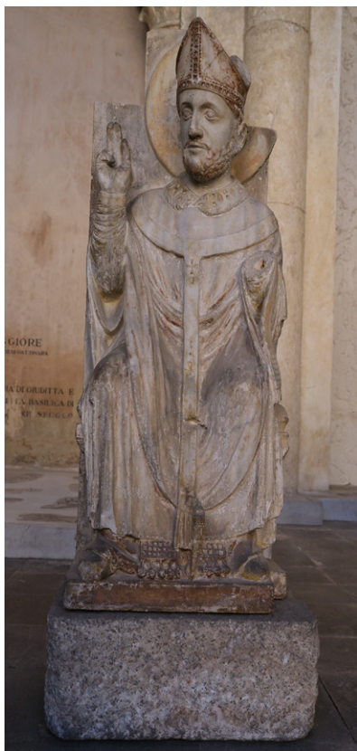
FIGURA 11. Vercelli, Museo Leone. Altorilievi raffiguranti il vescovo Eusebio (a sinistra) e un re mago (a destra), provenienti dall'edificio omonimo e attribuiti al pergamo.